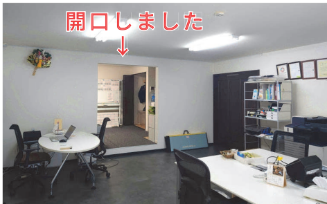
現在の相模原事業所、隣の部屋も賃借し、開口して部屋を拡げました。

パーソナルアシスタント横浜は2014年9月に開所してちょうど10年が過ぎたところです。また現在の事務所に移転（2017年2月）してからはちょうど7年です。やはり名残惜しいものがありますね……。一方、相模原事業所においては、2024年5月から現在の相模原事業所の隣室（1-A）を賃借し、壁に穴を開け（もちろん不動産屋さんの許可を取っています）スペースを拡げ、受入準備を進めておりました。隣室なのに段差があったのは想定外でしたが🌧