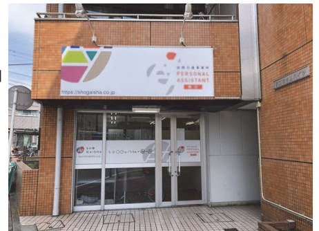
現在の横浜事業所(JR中山駅そば) 2025年1月31日で閉鎖します

統合後の新事業所名は「パーソナルアシスタント相模原」となり現在の相模原事業所（相模原市南区大野台7-6-1 旭荘1-B）にて業務を継続することになります。なお現在のパーソナルアシスタント横浜は2025年1月31日付けで閉鎖いたします。